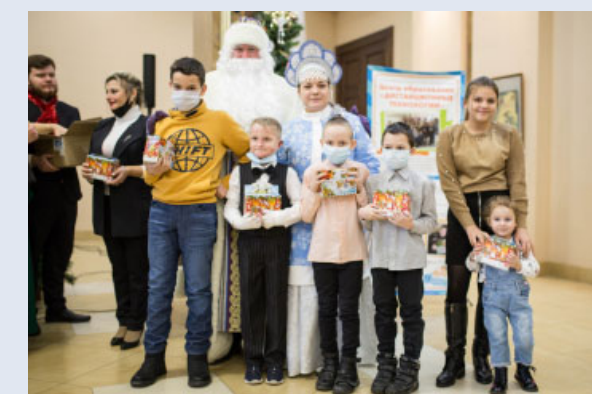
Юные зрители первого концерта проекта «Филармония по нотам» с подарками от филармонических Деда Мороза и Снегурочки.

Конечно же, какой новогодний концерт не мог пройти без Деда Мороза и Снегурочки! Тем более, что Дед Мороз был не простой, а музыкальный!